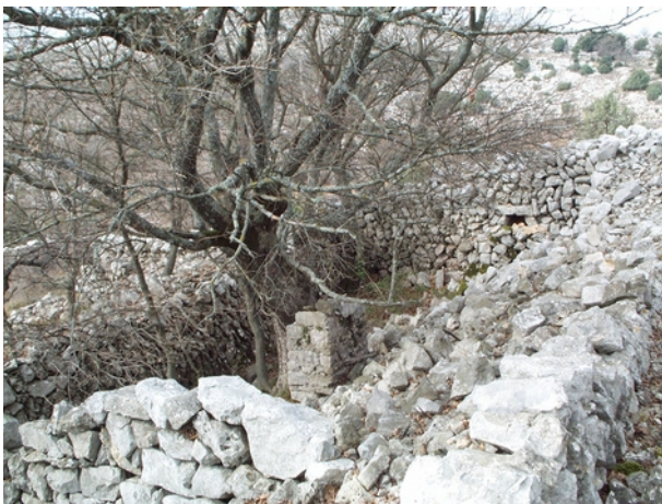
Habitat et partie de la bergerie autrefois couverts