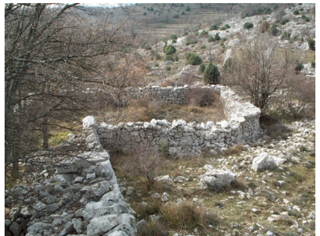
Sur cette photo, on aperçoit le deuxième enclos, dont le mur intérieur est daté de 1795.