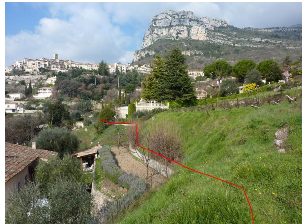
Passage du sentier en rouge sur le talus

Nous faisons demi tour et après un détour nous arrivons de l'autre coté de l'éboulement, à un bassin. Là, le chemin est évident, longeant un mur en pierres entre les parcelles 76 et 55. Le chemin continue dans un talus pentu, la terre a recouvert le sentier, le rendant inexistant.