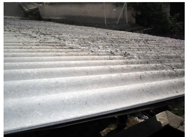
Plaques fibro-ciment en « amiante »

Remis à la mairie de Saint-Jeannet le : Date le Président