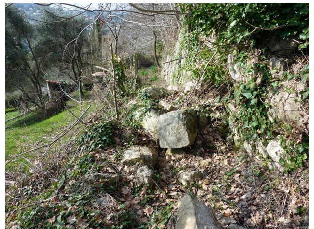
Amas de pierres