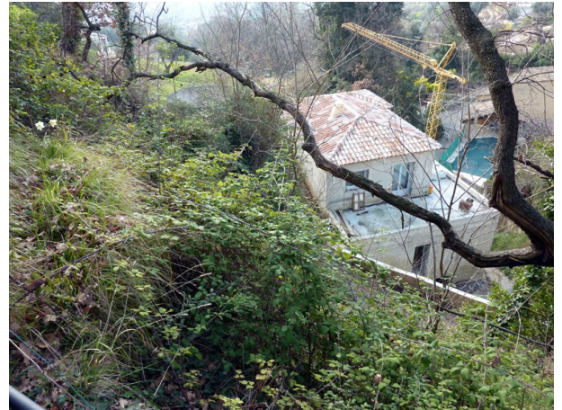
Construction en cours et effondrement

Nous faisons demi tour et après un détour nous arrivons de l'autre coté de l'éboulement, à un bassin. Là, le chemin est évident, longeant un mur en pierres entre les parcelles 76 et 55. Le chemin continue dans un talus pentu, la terre a recouvert le sentier, le rendant inexistant.