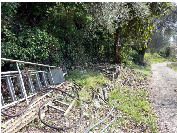
Matériel de chantiers, un arbre, des arbustes

Ensuite, après un passage entre des rochers, le sentier est évident au dessus de la parcelle 72. Il nécessite un bon nettoyage ( matériel de chantiers, un arbre, des arbustes ). Sur la portion restante un amas de pierres provenant du mur supérieur gêne considérablement. Cette partie restante a été débroussaillée et nous conduit au lavoir de Font Major. Le reste du chemin ne pose plus de problème, étant goudronné.