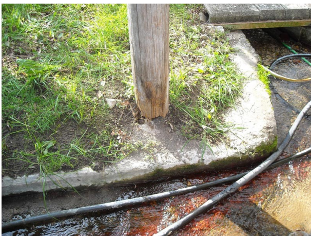
Poteaux absents ou descellés