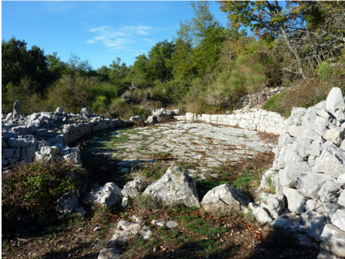
Aire de battage